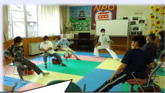
専門家による介護予防教室