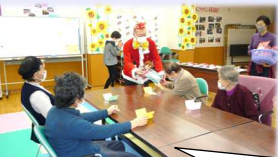
クリスマス会 サンタさんからプレゼント