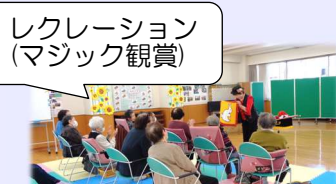
レクレーション (マジック観賞)