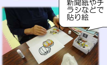
新聞紙やチラシなどで 貼り絵